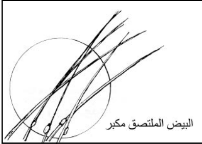
البيض الملتصق مكبر