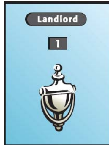
Contactez d'abord votre propriétaire / concierge.