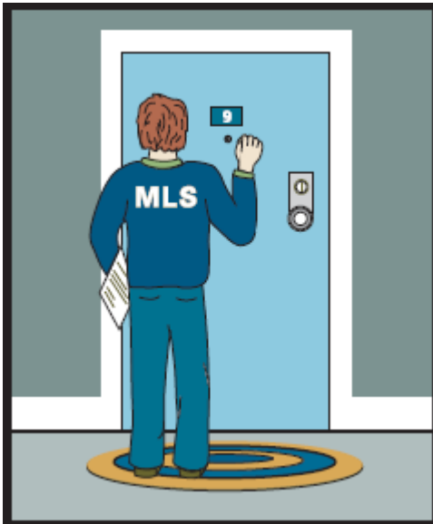
Un agent des normes de propriété va inspecter le logement.