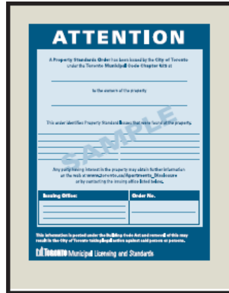
Une 'Ordonnance de conformité' pourrait être envoyée au propriétaire du logement.