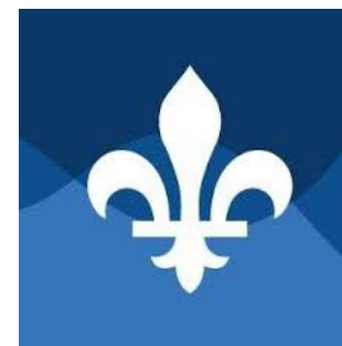
Ministère de la Langue française