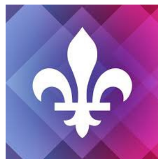
Ministère de la Culture et des Communications