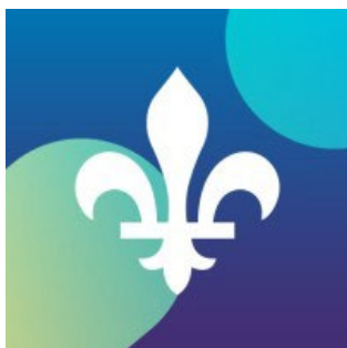
Ministère du Conseil exécutif