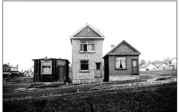
Coxwell Avenue, 1912, foto Arthur Goss, serie 372, sottoserie 18, articolo 5

Voglia notare che al momento di redigere la presente guida (agosto 2007), sono in corso di elaborazione vari documenti di ex amministrazioni comunali tuttora da includere nel nostro database. Invitiamo pertanto i ricercatori a tornare periodicamente agli Archivi per esaminare i detti nuovi documenti mano a mano che essi potranno essere messi a disposizione.