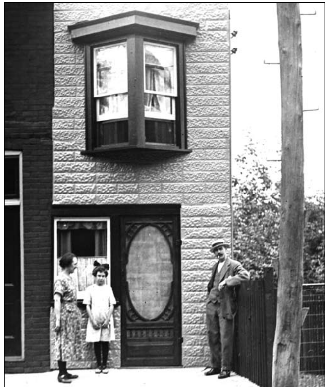
"La casa più piccola", 1913 circa, foto William James (dalla raccolta della famiglia). Raccolta 1244, articolo 82.14

Recarsi all'ente City of Toronto Archives con i mezzi pubblici è facile: basta uscire dalla stazione della metropolitana di Dupont, lungo la linea di University, e camminare in direzione nord.