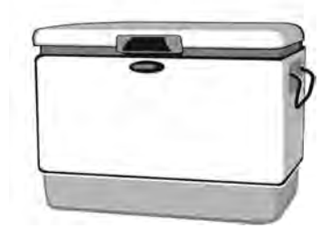
Glacière isotherme avec des blocs réfrigérants pendant 24 heures