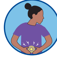
குமட்டல், வாந்தி, வயிற்றுப்போக்கு