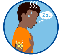
உடல்நிலை சரியில்லாமை, தசை வலி, சோர்வு