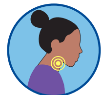
گلودردی، بلعیدن دردناک غذا

اگر جواب شما به 2 یا زیادتر از علائم "بلی" است: در خانه بمانید، خود را منزوی یا قرنطین نمایید و معاینات خویشرا تکمیل کنید و یا به ارائه دهنده خدمات طبی طفل خویش تماس بگیرید.