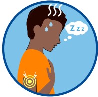
احساس بیمار شدن، درد عضلات، احساس خستگی