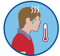
تب بالاتر از 37.8 درجه سانتی گرید

اگر جواب شما "بلی" است: در خانه بمانید، خود را منزوی یا قرنطین نمایید و معاینات خویشرا تکمیل کنید و یا به ارائه دهنده خدمات طبی طفل خویش تماس بگیرید.