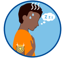
몸살, 근육통, 피곤