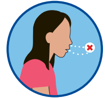
Perte du goût ou de l'odorat

Si « OUI » : Restez à la maison, isolez-vous et faites-vous tester ou contactez le prestataire de soins de santé de votre enfant.