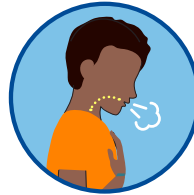
Difficulté à respirer