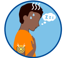
Malaise, douleurs musculaires, fatigue