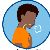
ਸਾਹ ਲੈਣ ਵਿੱਚ ਦਿੱਕਤ