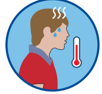
بخار > 37.8°C