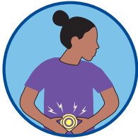
متلی، الٹی، اسہال