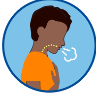
سانس لینے میں پریشانی