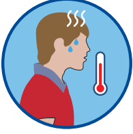
37,8°C üzeri ateş