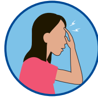
Pananakit ng ulo