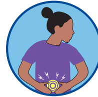
Pakiramdam na nasusuka, pagduduwal, pagtatae