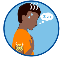
Masama ang pakiramdam, pananakit ng kalamnan, pagod