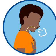
Kahirapan sa paghinga