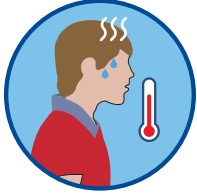
Lagnat > 37.8°C