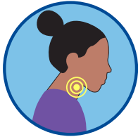
Pananakit ng lalamunan, masakit kapag lumunok