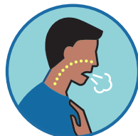
呼吸困难或呼吸急促