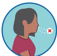
味觉/嗅觉下降或 缺失