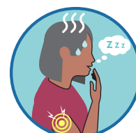
感觉不适、极度疲乏、肌 肉酸痛