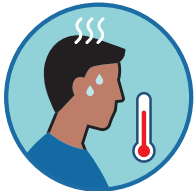
ርስኒ ወይ ቁሪቁሪ