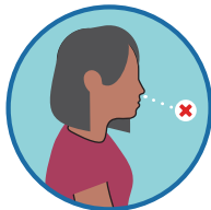
ናይ መግቢ ምሽታት ወይ ምስትምቓር ዓቕሚ ምጉዳል