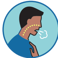
ጸገም ምስትገፋስ ወይ ሕጽረት ትገፋስ