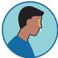
ጸረር ዝብል ኣገፍጫ