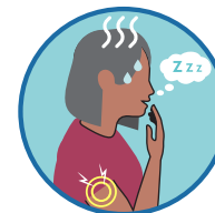
ብርቱዕ ድኻም፣ ቁርጥማት