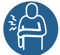
ਸਿਰ ਦਰਦ/ਸਰੀਰ ਅੰਦਰ ਦਰਦ

ਕਿਸੇ ਡਾਕਟਰ, ਨਰਸ ਜਾਂ ਫਾਰਮਾਸਿਸਟ ਨਾਲ ਗੱਲ ਕਰੋ।