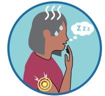
極度疲倦， 肌肉或關節酸痛* (年齡在18歲以上者)

如果您是因為已有健康原因而出現以上症狀的，請選擇“否”。如果症狀新發、與已有病症不同或出現惡化，請選擇“是”。