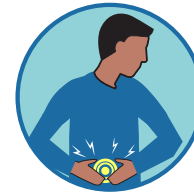
噁心、 嘔吐、腹瀉 (年齡在18歲以下者)