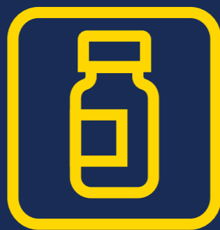
ਖੁਰਾਕ #2 COVID-19 ਵੈਕਸੀਨ