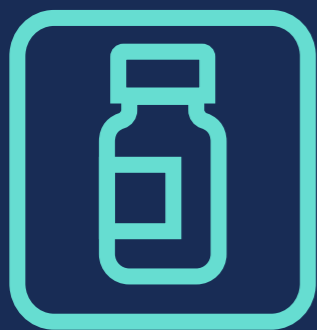
ਖੁਰਾਕ #1 COVID-19 ਵੈਕਸੀਨ