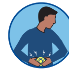
Nausea, vómito o diarrea (<18 años)