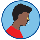
Secreción o congestión nasal