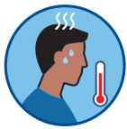
Fiebre > 37.8°C y/o escalofríos