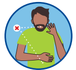
Disminución o falta de apetito