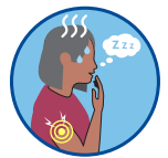
Cansancio, dolor muscular o de articulaciones (18+ años)