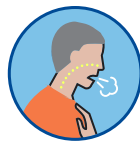
Dificultad para respirar