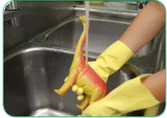
2 e évier : Rincer avec de l'eau propre