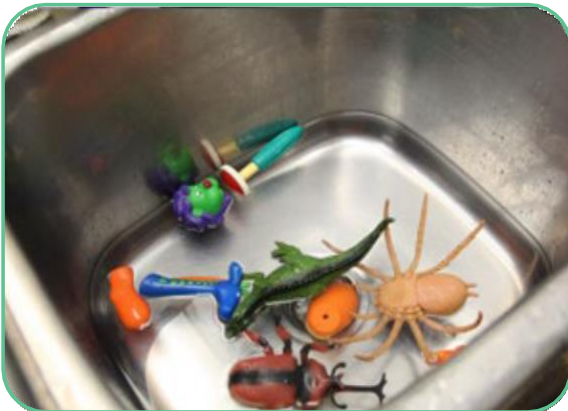
3 e évier : Désinfecter