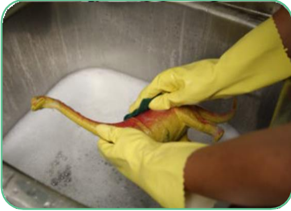
1 er évier : Laver avec un détergent