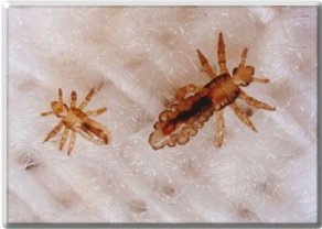
POUX (vus à la loupe)