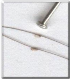
Lentes accrochées (agrandies)

Les oeufs de poux s'appellent « lentes » et ont environ la taille d'un grain de sable. Les lentes sont difficiles à voir et on les prend souvent pour des pellicules. Elles sont de forme ovale et sont habituellement jaunes ou blanches. Les lentes collent aux cheveux et sont difficiles à enlever. Elles mettent environ une semaine à éclore.